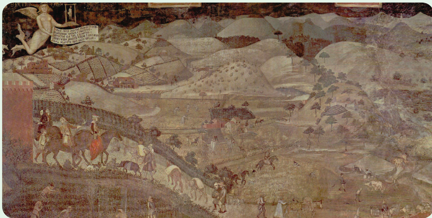
EFFETTI DEL BUON GOVERNO IN CAMPAGNA 1338-1339 | Sala della Pace | Palazzo Pubblico | Siena

STRATEGIE E POLITICHE SOSTENIBILI PER LA MONTAGNA MERIDIONALE